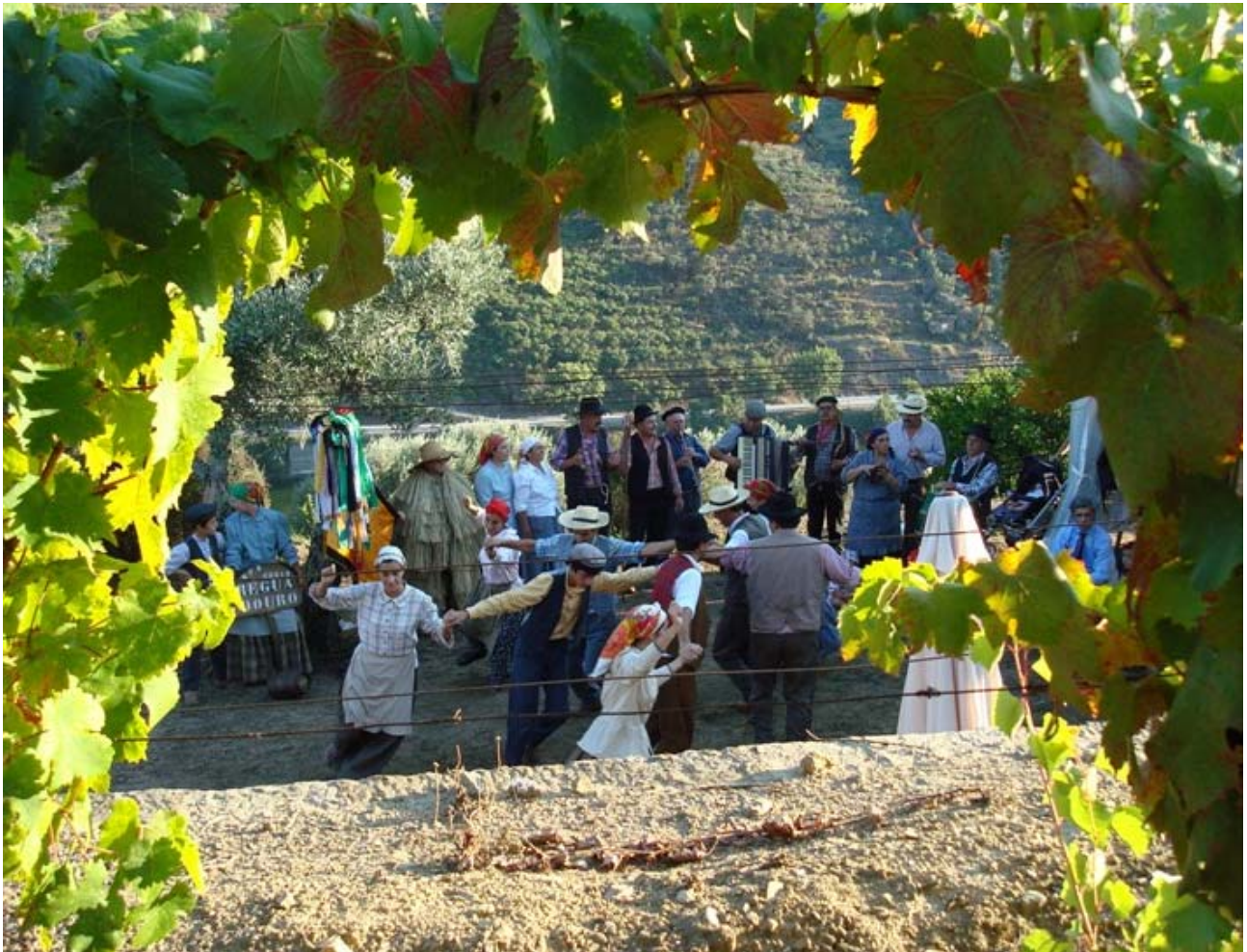
Actuação do Rancho no terrado, na Quinta Dona Matilde - Régua, em 01 de Setembro, animando uma cerimónia de um baptizado e aniversário de recém-nascidos, familiares dos Proprietários. Mostrando aos convidados pouco habituais nesta Região, os usos e costumes das tradições do folclore no Douro.