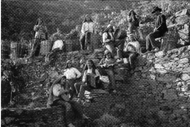
Vindimas no Douro - As Vindimadeiras na colheita das uvas, na faina das Vindimas. Os Homens fazendo uma pausa no transporte das uvas.

Está em marcha a campanha de angariação de fundos, destinada à aquisição de uma viatura ligeira de passageiros (9 Lugares), com o objectivo de apoio às iniciativas do Rancho.