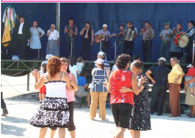
Tocata animou, em 02 de Setembro, a festa de inauguração do Polidesportivo de Galafura - Régua, no dia 8, na Qta. Campanhã e no dia 23, na Missa das Vindimas na Casa do Douro.