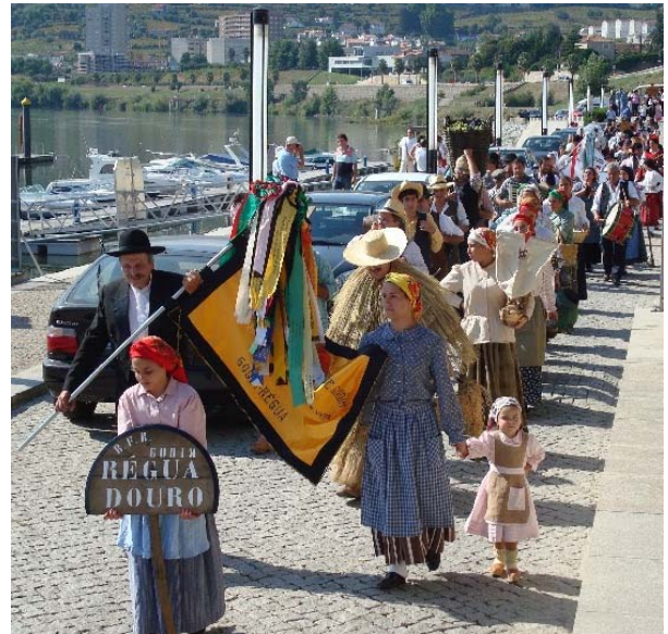
Tradições de folclore e etnografia animaram vindimas na Capital do Douro - Peso da Régua

Peso da Régua, Cidade Internacional da Vinha e do vinho, Capital do Douro, Património Mundial da Humanidade, foi palco do VI Festival de Folclore das Vindimas, no tabuado montado para o efeito no aprazível local Cais da Régua, organizado pelo Rancho Folclórico e Recreativo de Godim/Régua.