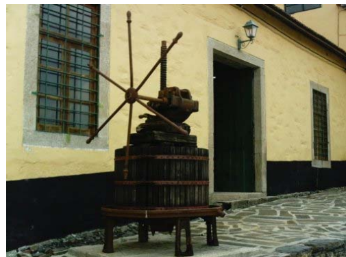
O Cincho onde o Bagaço das uvas é prensado