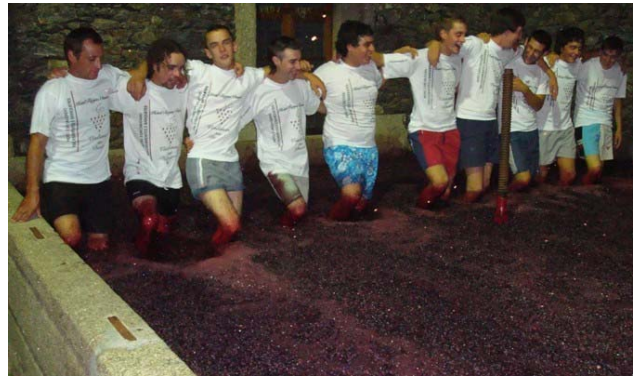
O Lagar na Poisa