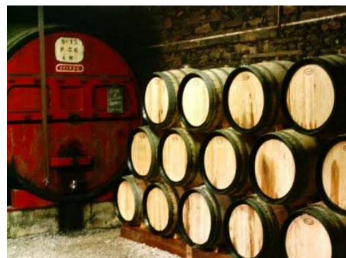
Pipas e Toneis (vasilhame)